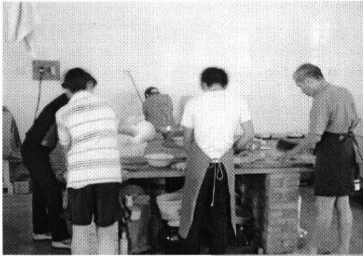
大孩子必须要帮厨