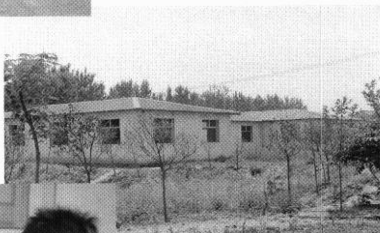
待建未完工的爱心小屋