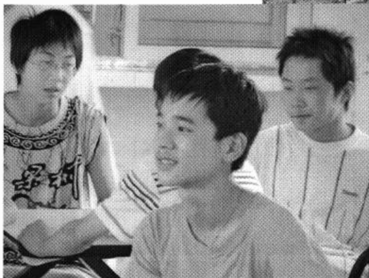
对未来充满希望的儿童村孩子